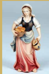
Art.-Nr.: 1247 · Wasserträgerin