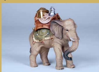
Art.-Nr.: 1246 · Elefant mit Gepäck