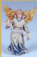
Art.-Nr.: 1205 · Engel