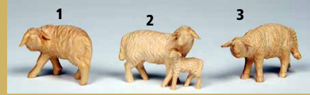
1) Art.-Nr.: 1619 · Schaf, zurückschauend 2) Art.-Nr.: 1622 · Schafgruppe, 2er, stehend 3) Art.-Nr.: 1620 · Schaf, nach vorn schauend