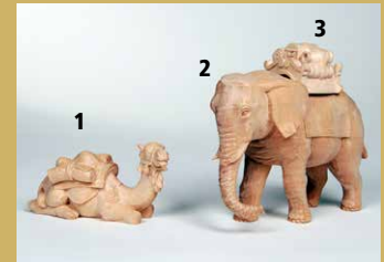
1) Art.-Nr.: 1635 · Kamel, liegend 2) Art.-Nr.: 1633 · Elefant (ohne Gepäck) 3) Art.-Nr.: 1642 · Gepäck für Elefant