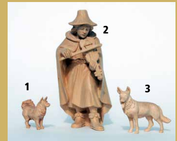
1) Art.-Nr.: 1628 · Spitz 2) Art.-Nr.: 1637 · Hirte mit Geige 3) Art.-Nr.: 1627 · Schäferhund

Besuchen Sie auch unsere ganzjährige Krippenausstellung!