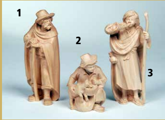
1) Art.-Nr.: 1608 · Hirte mit Stock 2) Art.-Nr.: 1606 · Hirte, kniend mit Ziege 3) Art.-Nr.: 1609 · Hirte mit Horn