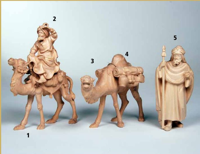
1) Art.-Nr.: 1631 · Kamel, stehend 2) Art.-Nr.: 1632 · Kamelreiter 3) Art.-Nr.: 1629 · Kamel, stehend (ohne Gepäck) 4) Art.-Nr.: 1641 · Gepäck für Kamel 5) Art.-Nr.: 1630 · Kameltreiber