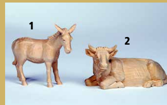
1) Art.-Nr.: 1614 · Esel 2) Art.-Nr.: 1613 · Ochse