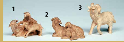
1) Art.-Nr.: 1624 · Schafgruppe, 3er, liegend 2) Art.-Nr.: 1621 · Schafgruppe, 2er, liegend 3) Art.-Nr.: 1615 · Widder