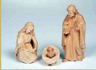
Art.-Nr.: 1601 · Heilige Familie