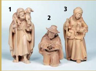
1) Art.-Nr.: 1607 · Hirte mit Schaf auf Schulter 2) Art.-Nr.: 1634 · Hirte, kniend betend 3) Art.-Nr.: 1610 · Hirtin mit Schaf