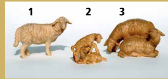
1) Art.-Nr.: 1618 · Schaf, schauend 2) Art.-Nr.: 1626 · Lammgruppe 3) Art.-Nr.: 1623 · Schafgruppe, 2er, stehend/liegend