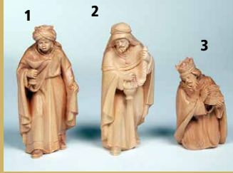
1) Art.-Nr.: 1603 · König, Mohr 2) Art.-Nr.: 1604 · König, weiß 3) Art.-Nr.: 1602 · König, kniend