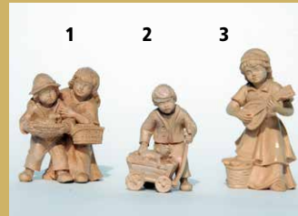
1) Art.-Nr.: 1612 · Kinderpaar 2) Art.-Nr.: 1611 · Junge mit Karren 3) Art.-Nr.: 1636 · Mädchen mit Mandoline