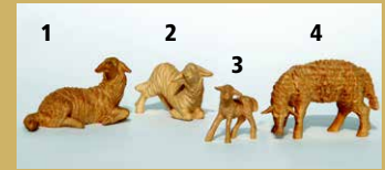
1) Art.-Nr.: 1616 · Schaf, liegend 2) Art.-Nr.: 1640 · Schaf, Gesäß hoch 3) Art.-Nr.: 1625 · Lamm, stehend 4) Art.-Nr.: 1617 · Schaf, fressend