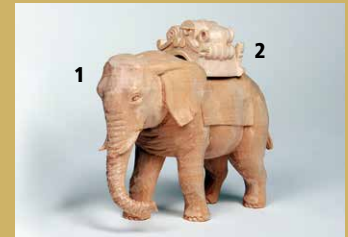
1) Art.-Nr.: 1633 · Elefant (ohne Gepäck) 2) Art.-Nr.: 1642 · Gepäck für Elefant