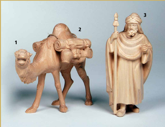
1) Art.-Nr.: 1629 · Kamel, stehend (ohne Gepäck) 2) Art.-Nr.: 1641 · Gepäck für Kamel 3) Art.-Nr.: 1630 · Kameltreiber